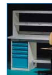
ÉTABLIS ET RANGEMENTS