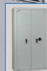
MOBILIER DE SÉCURITÉ